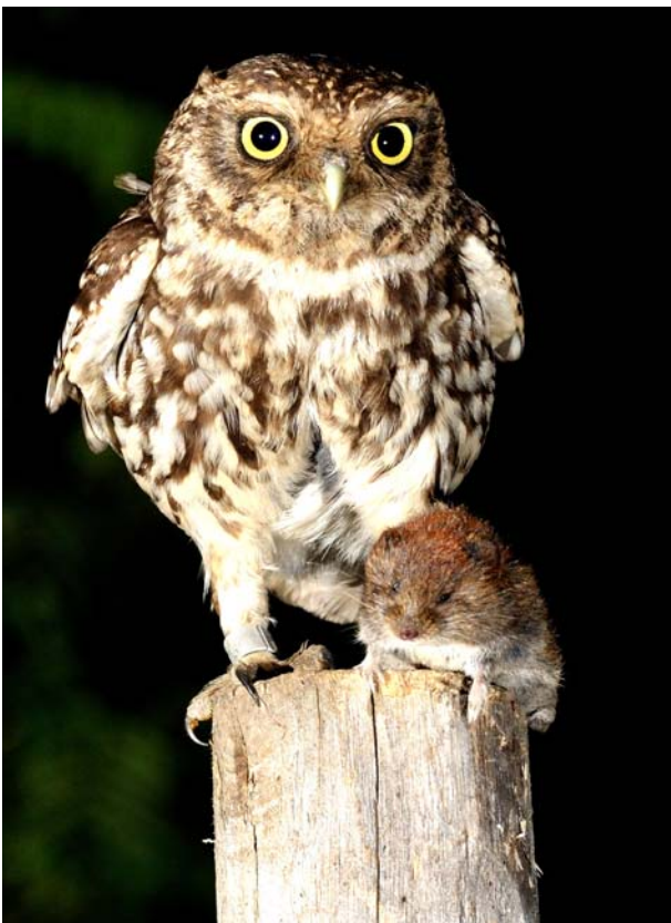
Chevêche avec un Campagnol roussâtre

L'inventaire 2009 a recensé 177 sites occupés par l'espèce , sur un territoire de 452 km 2 , correspondant à 55 communes.