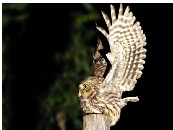
Tassement avant l'envol