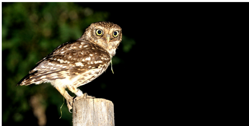
Chevêche avec un insecte en bec