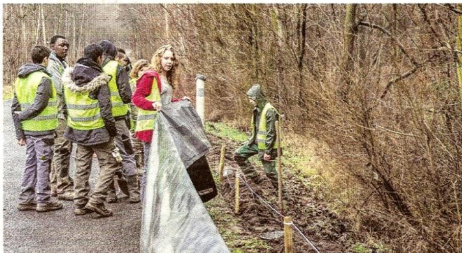
Depuis cinq ans, les élèves du CHEP (Centre horticole d'enseignement et de promotion) aident l'association Terroir et nature en Yvelines, à installer un batracodrome, dispositif qui permet de sauver près de 2000 batraciens chaque hiver.

L'enjeu : sauver 2 000 batraciens. « À la fin de l'hiver, ils quittent les bois où ils ont séjourné en léthargie pour aller se reproduire dans l'étang. Pour éviter qu'ils ne se fassent écraser, un barrage en plastique est mis en place de chaque côté de la route pour les empêcher de traverser. Des seaux sont disposés tous les cinq mètres pour les capturer. Puis une équipe de volontaires assure alors leur transfert de l'autre côté de la route en toute sécurité, et ceci durant deux mois, à l'aller