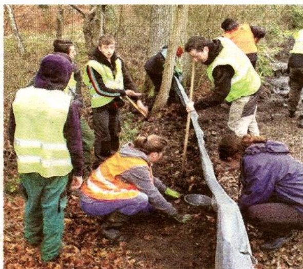
Depuis cinq ans, les élèves du lycée horticole du Tremblay-sur-Mauldre contribuent à l'installation du dispositif.