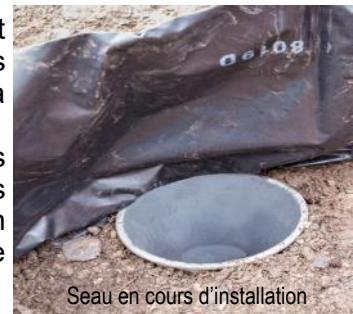
Seau en cours d'installation

Lorsque des Batraciens longent cette barrière, ils tombent dans des seaux enterrés le long de la bâche. Chaque matin des volontaires ramassent les Batraciens dans les seaux pour les porter en toute sécurité de l'autre côté de la route.