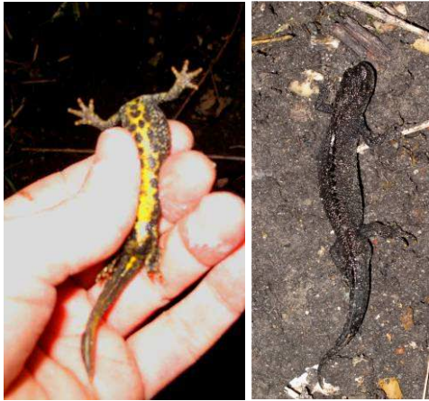
Triton Crêté (Triturus cristatus), femelle, dessous, dessus (mais non ! personne n'a coupé la tête de personne, Mme regarde juste ailleurs !)