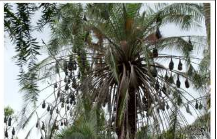
Arbre à Roussette

Et si vous désirez déguster d'autres photos, n'hésitez pas à visiter le site de Benjamin www.benjamin-munoz.tk