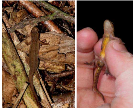
Triton Palmé (Lissotriton helveticus), femelle, dessous, dessus