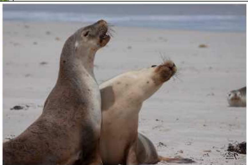
Lions de mer