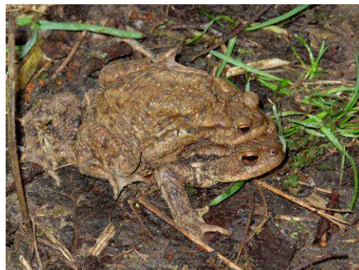
M. et Mme Bufo Bufo