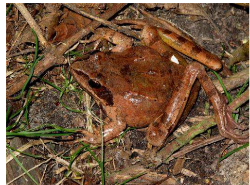
Grenouille agile (Rana dalmatina)