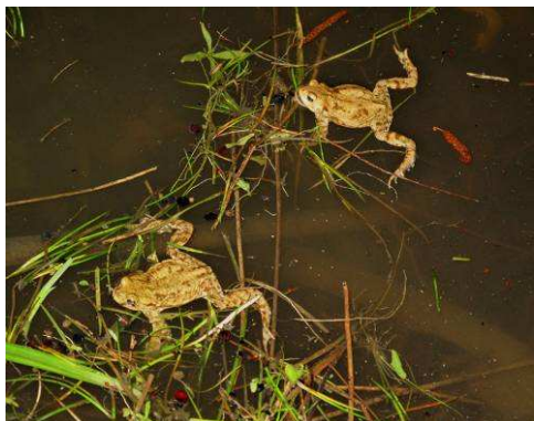
Crapauds communs (Bufo bufo)

Total : 460 batraciens « traversés » au 22 mars 2010